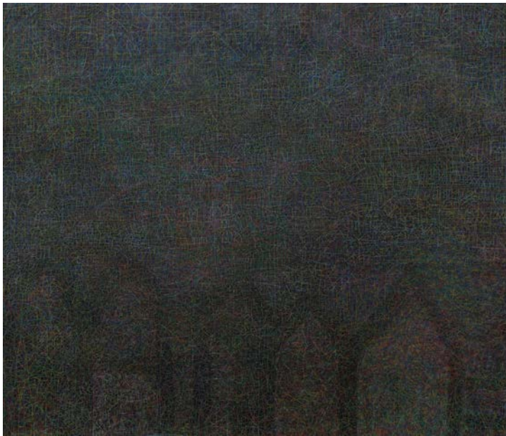
«In die Nacht ausbuchstabiert», 2007, Zeichnung mit Ölfarbstiften auf Leinwand, 170 x 150 cm. Bild: Christian Lippuner