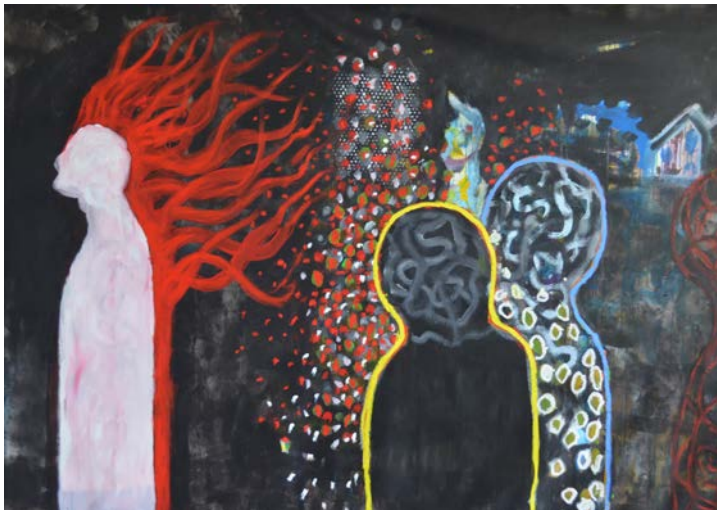
«Die Einheit brennt», 2017, Öl und Acryl auf Leinwand, ca. 150 x 218 cm. Bild: Christian Lippuner

Nachdem Christian Lippuner aktuell den Medikamentenkonsum reduziert hat, ist vorübergehende Lethargie neuer Dynamik und Frische gewichen. Er war immer guten Mutes. Die Ankäufe der St. Gallischen Kunstsammlung haben ihm Auftrieb gegeben, die Thurgauer seien da zurückhaltender. «Die Nichtaufnahme bei den jurierten hiesigen Werkschauen haben mich richtiggehend frustriert zurückgelassen», bekennt er, «ein paar wenige Bilder sind mittlerweile und zu meiner grossen Freude in die Sammlung des Kunstmuseums Thurgau gekommen.» Die Mitgliedschaften in Künstlerverbänden (visarte/Gruppe Xylon Schweiz) sind ihm Genugtuung. Verkaufen könne er im Grunde gut. Auf die Frage, was für ihn diese absolute Zuwendung zur Malerei bedeute, antwortet er in stichhaltiger Verträumtheit: «Musik, Gesang, vor allen Dingen Spiel.»